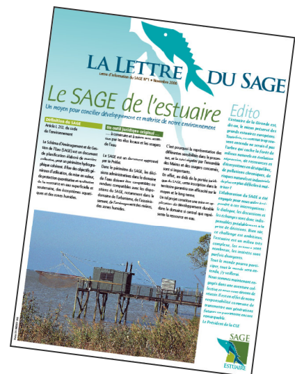
La lettre du SAGE

La Lettre du SAGE a été envoyée par courrier aux membres de la CLE, aux Maires des communes, aux services des collectivités (EPCI, Pays), aux associations syndicales de marais, aux syndicats intercommunaux de bassins versants, aux syndicats d'eaux et d'assainissement ainsi qu'aux associations concernées. Des exemplaires supplémentaires sont disponibles à la demande.