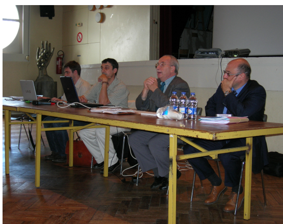
Commission « Médoc » le 18 mai 2006

Cette première série de réunion a permis de (re)mobiliser les acteurs autour de l'élaboration du SAGE. Les 7 réunions ont réuni 217 personnes (dont 142 personnes différentes). La mobilisation a été satisfaisante (31 personnes par réunion en moyenne soit entre 50 et 60% des invitations). Les différents collèges (collectivités, usagers, Etat) ont été représentés à l'ensemble des réunions.