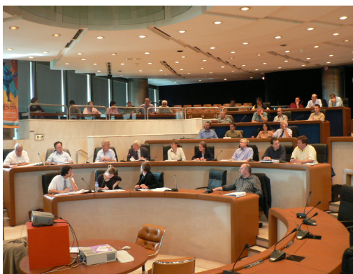
CLE du 5 octobre 2006 à Bordeaux

La mobilisation a donc été importante avec une présence d'environ 72% de membres votants à chaque réunion, ce qui prouve l'intérêt porté au sujet. Les débats ont par ailleurs été toujours constructifs et de bonne tenue, sachant que les problèmes de fond n'ont pas encore été abordés pendant cette première année.