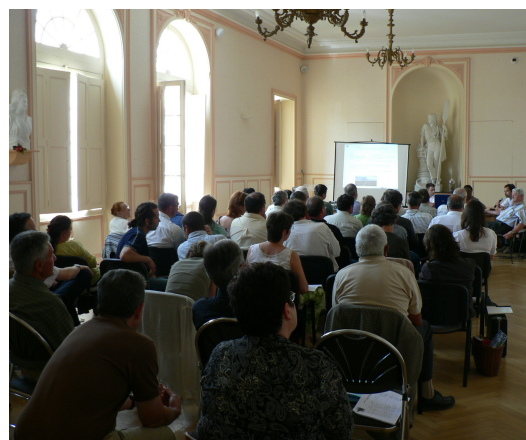
Commission « Marais et bassins versants » le 21 juin 2006